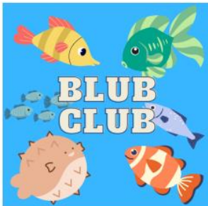
Groep 4a won met de naam Blubclub!

Groep 4a won daarmee een traktatie voor de hele klas, gefeliciteerd!