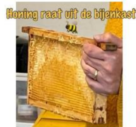
Honing raakt uit de bijenkast