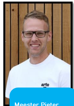
Meester Pieter Groep 7a ma, di, wo, do, vr ICT-coördinator Rekencoördinator