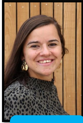
Juf Alinda Zeepaardgroep ma, di, vr