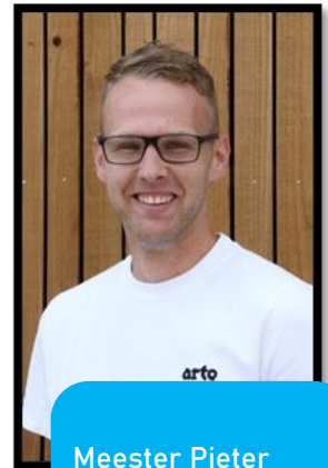
Meester Pieter Groep 8b ma, di, wo, do, vr ICT-coördinator Rekencoördinator