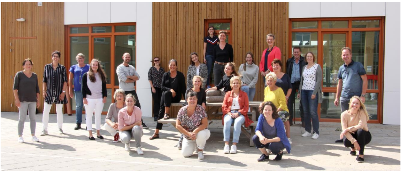
Teamfoto, 28 augustus 2020.